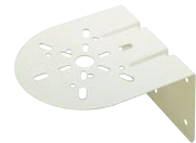
壁面取付けブラケット SZ-008型 価格 3,000円(税抜き)