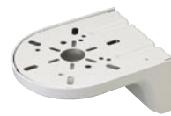
壁面取付けブラケット SZ-023型 価格 5,800円(税抜き)