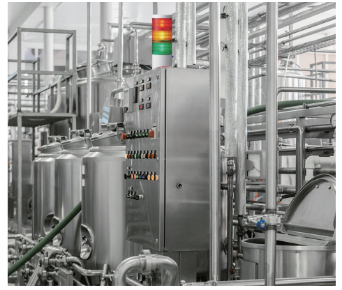
IP69K対応 食品・薬品工場に