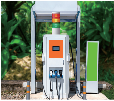
屋外での 注意喚起に