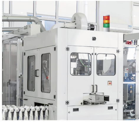
制御盤や産業機械の 状態報知に