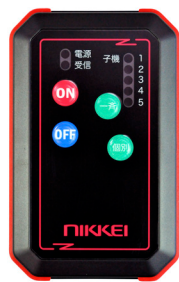
MUS03W FSK MU03LS LoRa